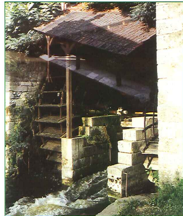
Le moulin de Pont-de-Ruan Le lavoir communal de Thilouze