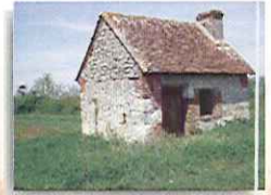
Loge de Vigne

Très bien exposés sur le coteau, les 120 hectares de vignes permettent la production de l'AOC : le Touraine Amboise. Certaines loges de vignes, qui servaient d'abris aux vignerons subsistent au milieu des cultures.